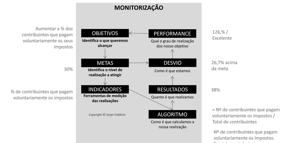
Figura - Esquema da relação de conceitos de gestão estratégica com a função Monitorização

Ao nível do acompanhamento da performance dos objetivos, existe também um modelo relacional com a função Monitorização.